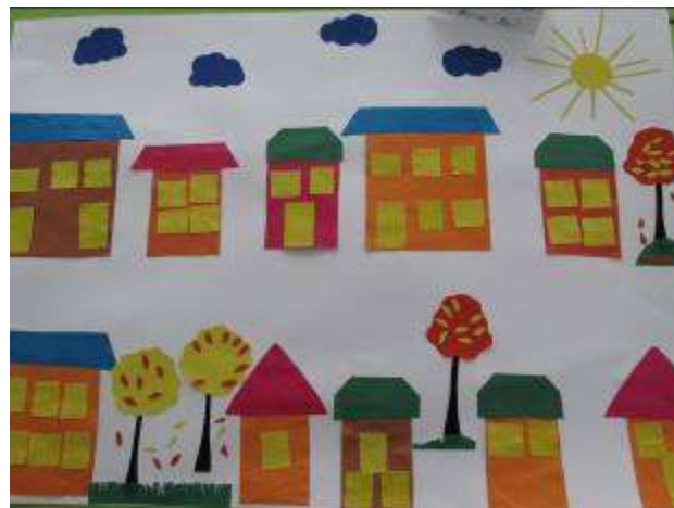
Аппликация «Моя улица»