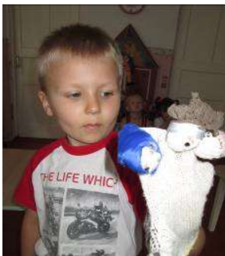
«ПАПА, МАМА, Я – ДРУЖНАЯ СЕМЬЯ!» (играем в пальчиковые игры)