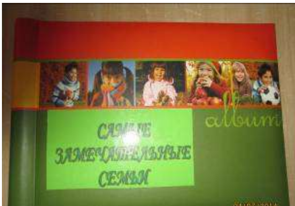
АЛЬБОМ «САМЫЕ ЗАМЕЧАТЕЛЬНЫЕ СЕМЬИ»