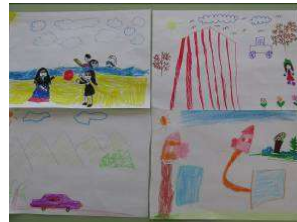
Рисование «Каждый имеет право на отдых»