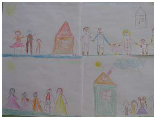
Рисование «Моя семья»