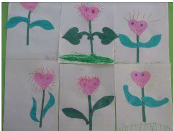
Аппликация «Волшебный цветок»