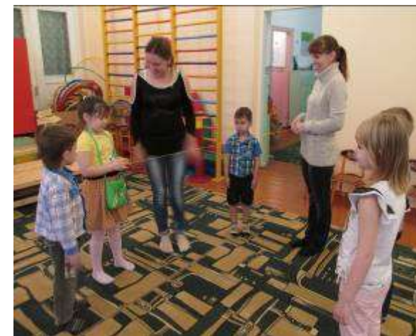
Игровой тренинг с детьми и родителями «Твои права малыш!»