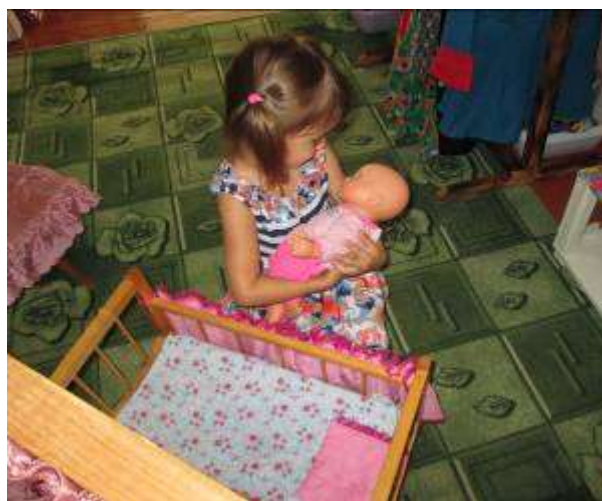
СЮЖЕТНО – РОЛЕВЫЕ ИГРЫ «СЕМЬЯ», «ДОЧКИ – МАТЕРИ», «Салон красоты» и т.д.