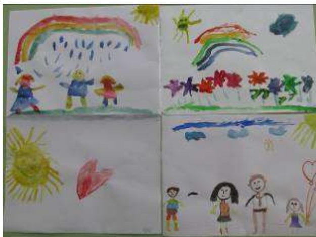
Рисование «Мое настроение»