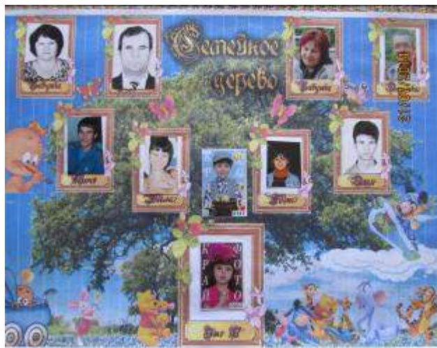
АЛЬБОМ «ДРЕВО МОЕЙ СЕМЬИ»