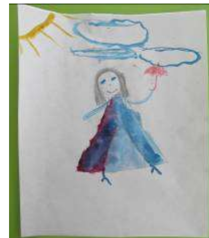
Рисование «Герои сказок о правах детей»