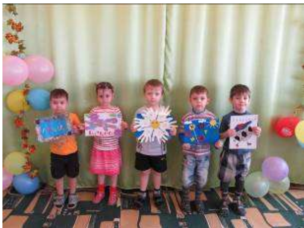
Детско – родительская выставка « Я имею право на имя»