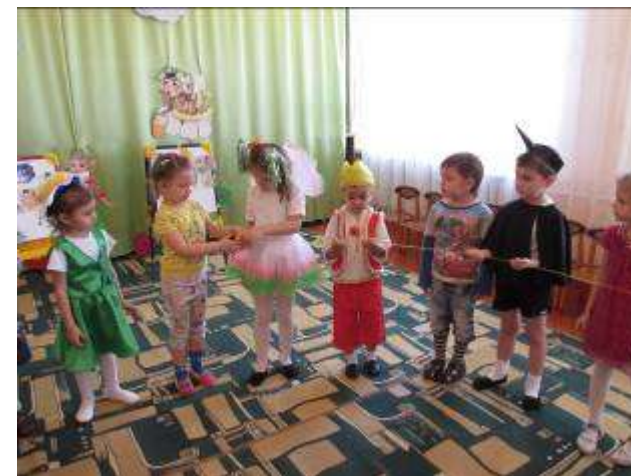
Театрально – игровое мероприятие «Я имею право...»